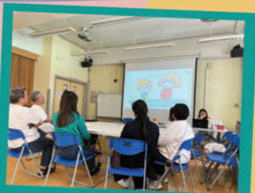
「Chill」級家長小組 @ 深水埗官立小學