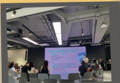
「衝」鋒父母工作坊 @ 播道書院