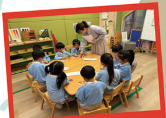
和諧家庭小天使 兒童小組 @ 禮賢會順天幼兒園