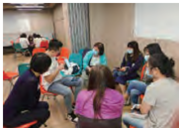
大型社區活動，推廣利用資訊科技工具強化家庭關係及促進溝通