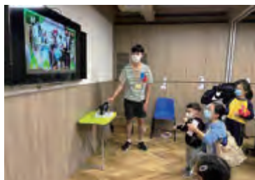
於不同網上及實體活動中利用資訊科技工具，強化參加者的家庭關係