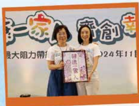
社會福利署署長李佩詩太平紳士

活動很高興邀得社會福利署署長李佩詩太平紳士以及立法會議員狄志遠博士，SBS，太平紳士擔任主禮嘉賓。