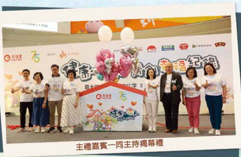
主禮嘉賓一同主持揭幕禮