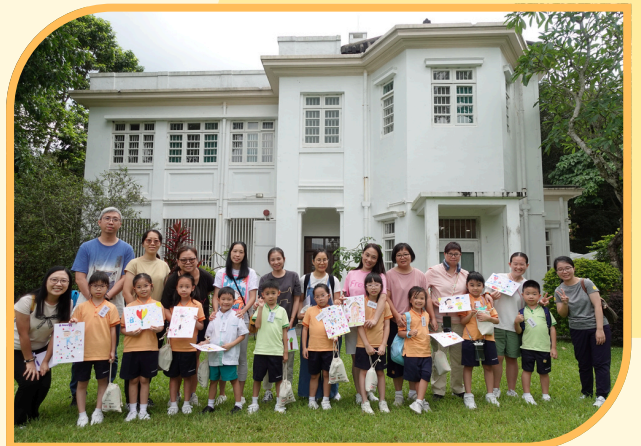
合辦：沙田圍胡素貞博士紀念學校