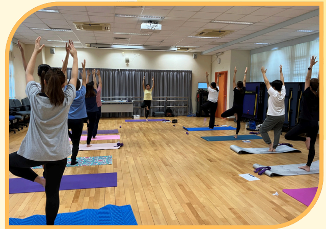
合辦：沙田圍胡素貞博士紀念學校