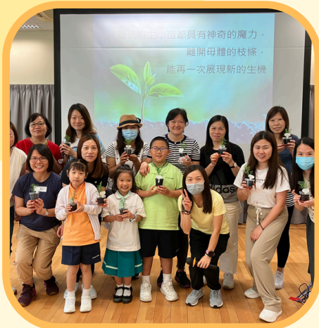
合辦：沙田圍胡素貞博士紀念學校