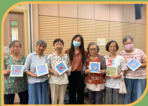
合辦：中華傳道會恩光長者鄰舍中心