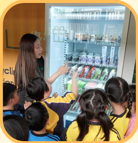
合辦：家福會葵涌(南)綜合家庭服務中心