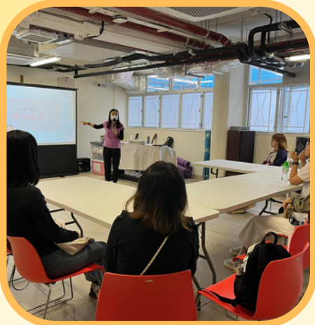
合辦：家福會屯門東服務中心 救世軍三聖幼兒學校