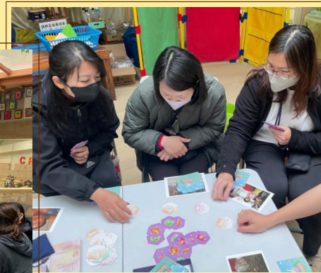
合辦：家福會屯門東服務中心 真理浸信會富泰幼稚園